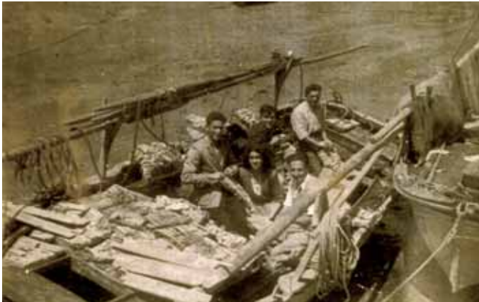
Os domingos aproveitábanse para asollar e arranchar

O vento rolou a nortiño e a marea tiraba para o sur, así que houbo que arriar o pavieiro e largar de norte a sur a favor da marea e do vento, todos parexos, gardando distancia para non apariguar (xuntarse as redes) e non derivar a unha zona de baixos.