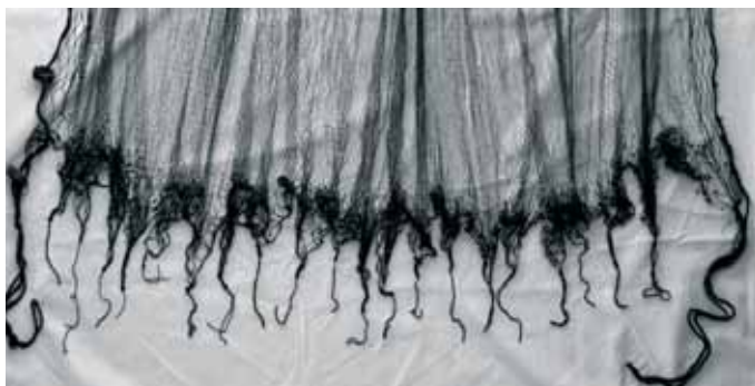
Cabeza da peza con matafións

días de tormenta poñíanse a facer rede. Unha vez rematado o pano eles mesmos armaban o aparello, tal e como explicamos anteriormente, incluíndo os “plomos” que eles mesmos fundían e aos que lles daban forma de maneira artesanal.