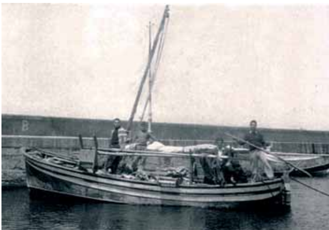
Racú de vela no peirao. Apréciase a vela aferrada, a dos anos 30

A tripulación aproveitou para prender o chisqueiro e calar un pitillo, comer algo, botarlle un trago de viño da bota