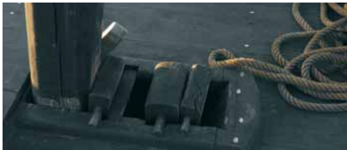
O chumbeiro a carón da foganadura

O venres levábanse as “pesas” para terra, e había que secar e atar. O sábado encascábase e deixábanse “escorrir” 6 ata o luns, que había que secar e carrexar para abordo e saír para o mar.