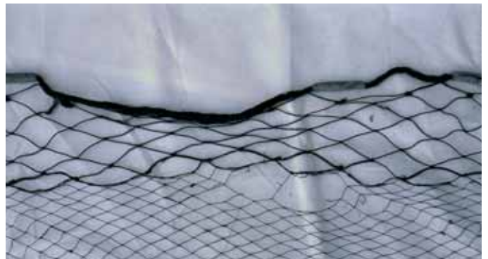
Tralla do chumbo na que se aprecia a cadeneta