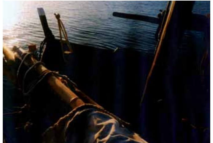
Dorna xeiteira buscando xeito ao axexo

Prenderon lume na cosedoirá con estopa empapada en gasoil para axudar á leña, e fíxose un café de pota con achicoria. Que bo estaba!, eu nunca o probara sen leite. De alí a un pouco, o caldeiro comezou a bater. Xa amenecía. Fomos á popa e unha quenlla de metro e medio daba unhas idas tremendas co anzol aferrado na gorxa; metémola a bordo. De seguido fomos mirar a rede, e apenas tomamos unha ducia de sardiñas. O lance do manexo non era moi prometedor. Meu pai decidiu deixar ir o lance ata