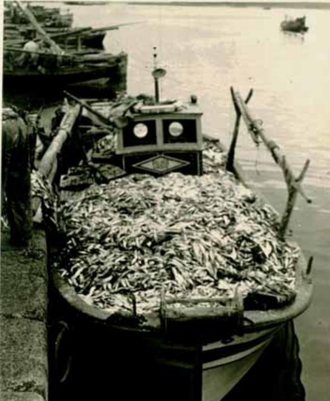
O Rubí, a finais dos anos 50, cargado co lance do día sen debagar

fomos descargar ó Peirao de Cantodorxo, que aínda hoxe existe, en tal estado.