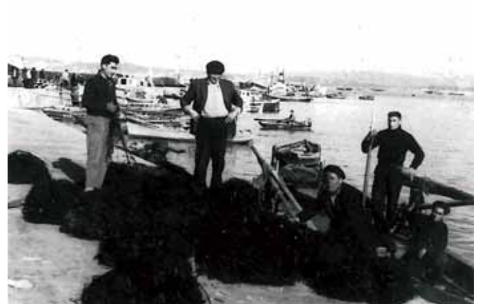
Metendo as pesas a bordo despois de encascar

Era habitual mentres se estaba largo botar unha liña a pescar ás fanecas, sobre todo con lúa, ou pola popa ás quenllas. Mesmo se se fondeaba a media noite na pedra pescábanse congros, botando unhas xogadas cun pandullo ó fondo, para tomar a caldeirada e non comer só sardiñas, sobre todo cando se facían mareas de varios días fora da casa, traballando pola ría de Muros ou Fisterra nos comezos da seifa, cando se botaba unha ou dúas semanas.