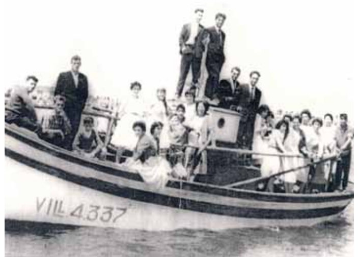
O Rons , na procesión das festas do Carme do ano 1957.