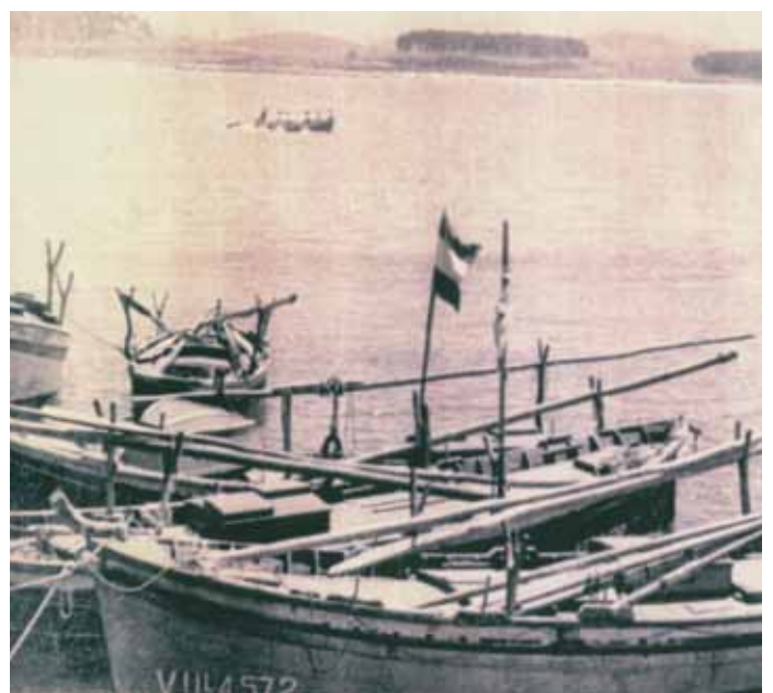
Imaxe dun racú coa cachola armada na proa.