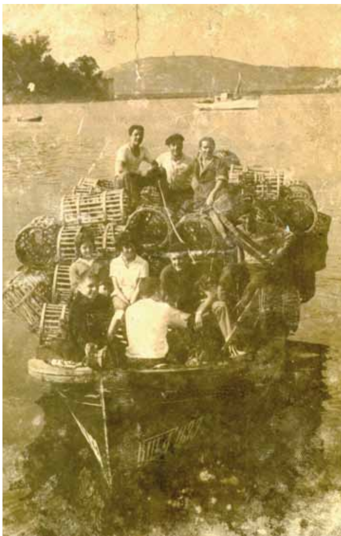
Racú do Grove cargado de nasas en Baiona.

“Aos 9 anos xa ía ao mar. Comecei de rapaz escollendo cadelas (ameixas) andando ao rasto. Dábanme dous reais (50 céntimos de peseta) cada día. Non era parte nin quiñón, era un “changuí” (propina) polo xornal de traballo. Á escola ía de noite, e aos 12 anos