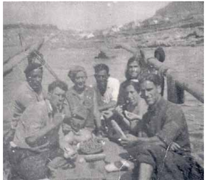
A tripulación do Xon número 3 , nun momento de descanso.

No mar de Ons faenábase na Freitasosa, Magalan, Monte Seco a Minguella, Suances e a Porta. (Postas situadas polo Oeste e Suroeste de Ons e a Onza).