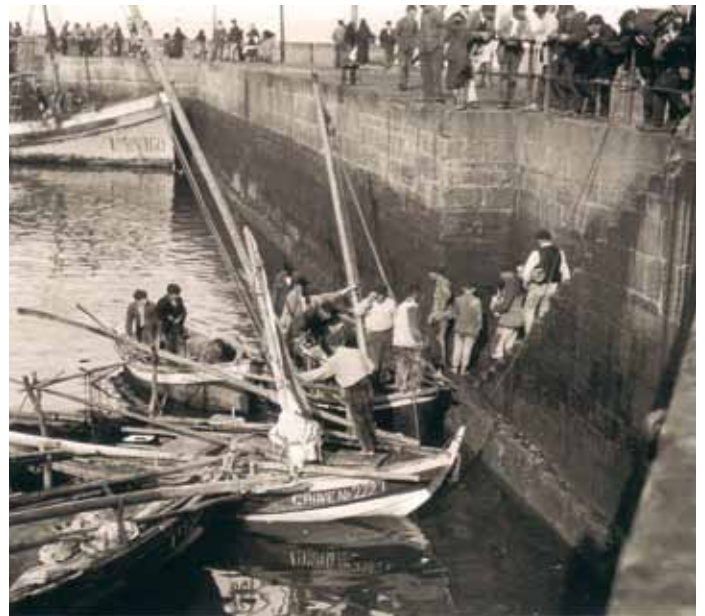
Dornas e racú mecos en Vigo no 1925.