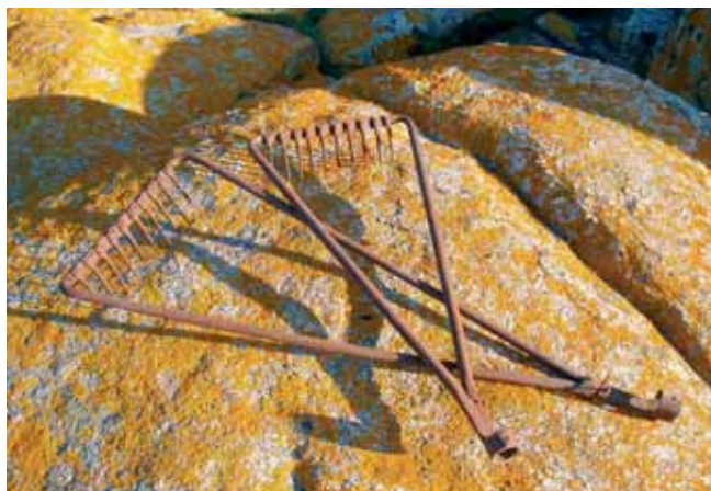
Antigos rastos de remaches.

firme na proa da doma. Logho dábamos uns bos tiróns de popa para comprobar que os risóns non veñían a gharrea. Unha ves ben firmes amarrabamos o cabo de popa ben asocado por un dos costados. Metíamoslle media beta máis ó cabo cando íbamos pó Bao da Arousa ou cando traballábam no alto.