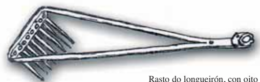
Rasto do longueirón, con oito dentes

Unha ves ben aparelados e sabendo as postas, o xeito de traballar o rasto era ben fásil. Dábamos fondo co risón de popa, boghábamos por riba da sona que queríamos traballar, arreábamos dúas medias betas de cabo e unha ves fondeado o risón de proa, portábamos polo cabo de popa e fasíamos