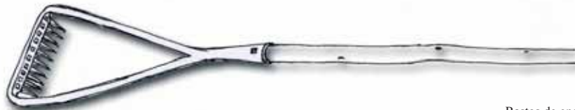
Rastos de enchufe

Eran mediados os anos trinta, cando por primeira vez fun ó rasto a escoller con meu pai. Este era considerado un ofisio moi caballero , e a min enchíame de orgullo formar parte del, e sobre todo aportar axuda á casa, e esto sin deixar de ir á escola de noite.