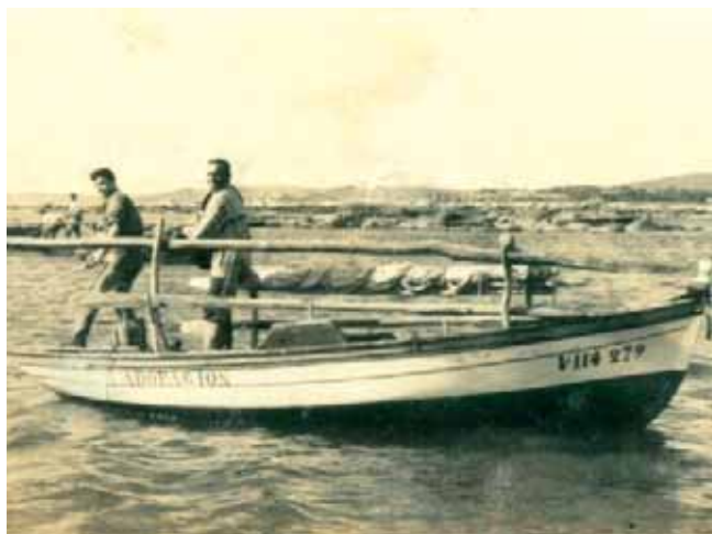
Dorna de tope traballando ao rasto

boca do pano vai atada cuns cotes co mesmo sistema anterior. Despois esta varilla átase ó rasto cunhas trincas salteadas nos buratos da plancha e nas barras do rasto. Este sistema fasilitou a posibilidade de que en caso de rotura, se puidese cambiar o pano con máis rapidés, xa que tiñamos montado o pano de repostado sobre outra varilla .