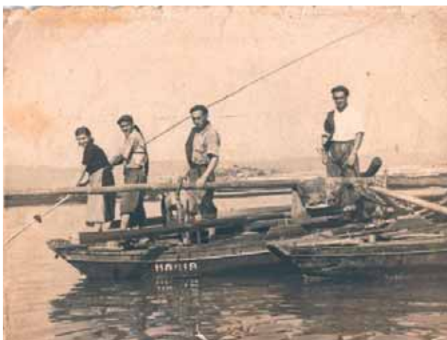
Traballando ao rasto

A misión fundamental da ghoma era protexer ó rasteiro da molladura da vara e do rose da mesma. Compoñíase dunha ghoma de neumático de camiión recortada a medida e peghada no ombrei- ro. Levaba á súa ves un sinto de coiro cunha febi- lla , o cal se ataba arredor da sintura, de xeito que a ghoma protexía o costado e debaixo do brazo do rasteiro.