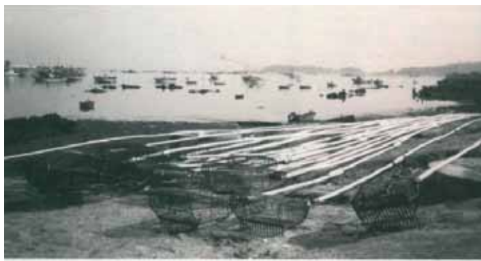
O raño, arte que substituíu ao rasto (1980).